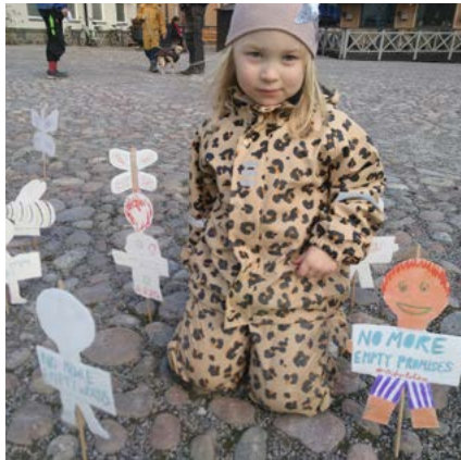
Klimatmanifestation 19 mars 2021