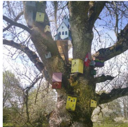
Mälby naturstig 22 maj 2021