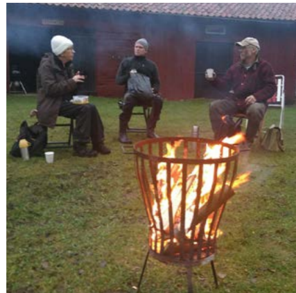
Adventsvandring 6 december 2020