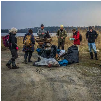
Skräpplockning 27 mars 2021